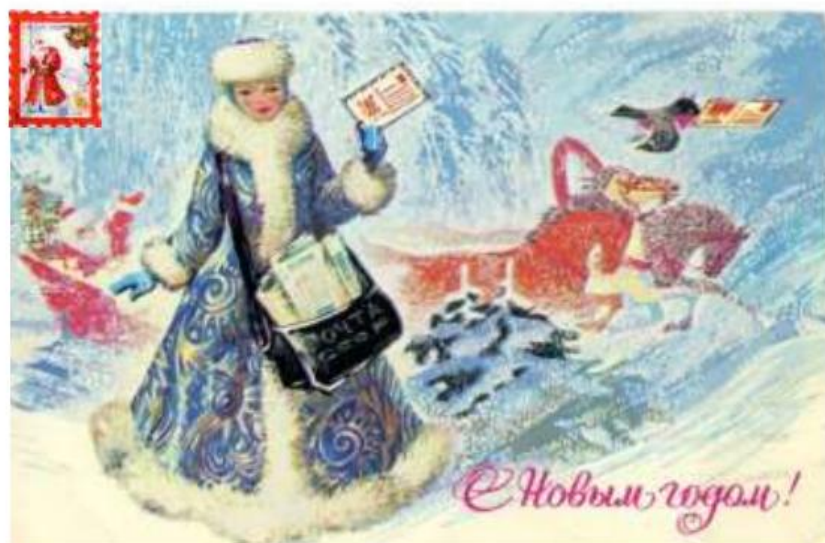
Открытка родным и друзьям (с почтовой маркой)*